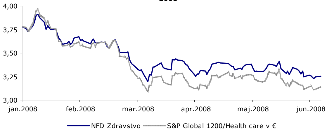
Gibanje VEP NFD Zdravstvo in primerjalnega indeksa v prvem polletju 2008*

* Vrednost primerjalnega indeksa S&P Global 1200/Healthcare je zaradi primerjave preračunana na enako osnovo z VEP sklada.